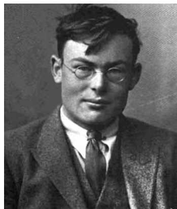
Frank Ramsey (1903-1930)

În continuare să introducem f(K_t) funcția de producție dependentă de capitalul K_t , cu următoarele proprietăți: f(0) = 0 , f'(0) = \infty și f'(\infty) = 0 , (Inada conditions [1963]).